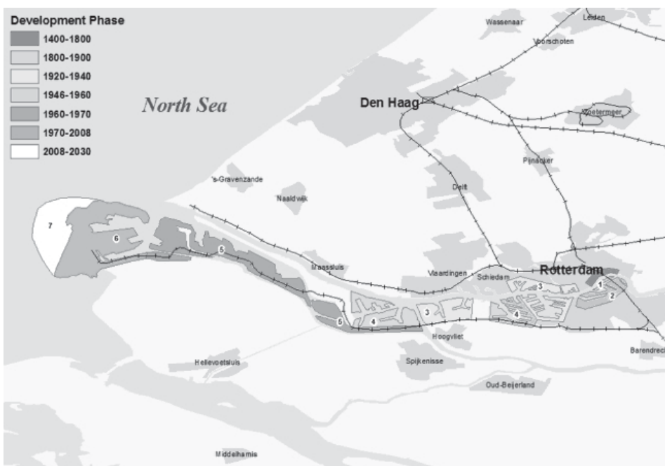
Rys. 3. Etapy rozwoju portu w Rotterdamie