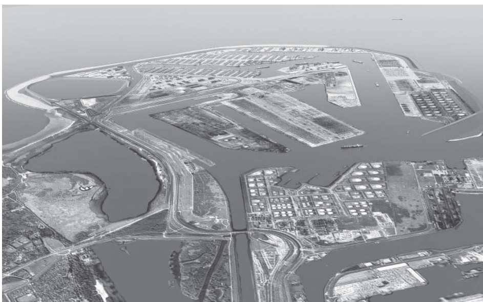
Rys. 4. Maasvlakte 2 – panorama od strony południowo-wschodniej (wizualizacja)