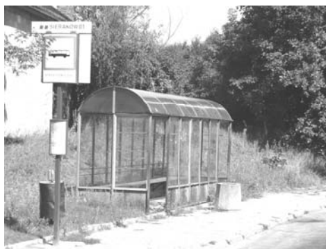
Rys. 6. Pętla autobusowa w Sierakowie (fot. autor)

Komunikacja publiczna zapewniona jest linią MZK Nr 726 – Warszawa (plac Wilsona) – Mościska – Laski – Izabelin – Sieraków. Szacuje się, że średnio dojazd z Sierakowa do placu Wilsona zajmuje około 40 minut (rys. 6). Niestety częstotliwość kursowania autobusów to raz na godzinę w dni powszednie i co około 1,5 godziny w soboty, niedziele i święta.