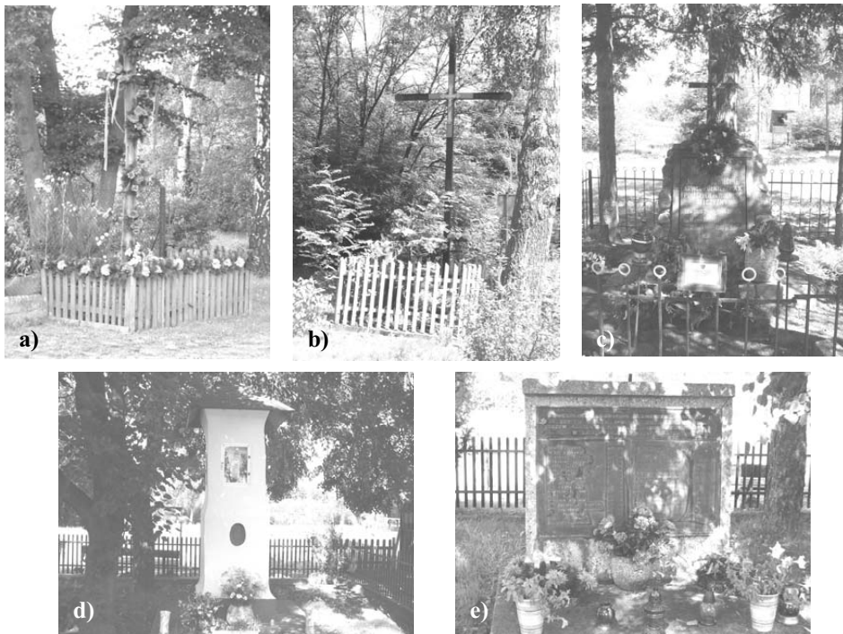
Rys. 2. Obiekty kulturowe we wsi Sieraków: a i b – przydrożny krzyż, c i e – miejsca pamięci narodowej, d – kapliczka (fot. autora)

Materiałne wartości kulturowe nie są zbyt bogate, ale mają odzwierciedlenie w miejscach pamięci narodowej, miejscach kultu religijnego i stanowiskach archeologicznych. Są to (rys. 2):