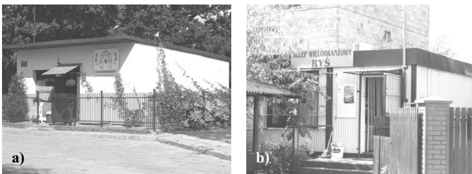
Rys. 4. Obiekty usługowe we wsi Sieraków: a i b – sklepy