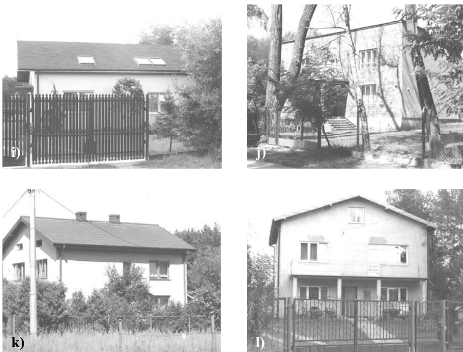
Rys. 3. Zabudowa mieszkaniowa we wsi Sieraków: a, b, c, d, g – budynek parterowy z nieużytkowym poddaszem, e, f, h, i – budynek parterowy z użytkowym poddaszem, j – budynek piętrowy bez poddasza, k, l – budynek piętrowy z poddaszem